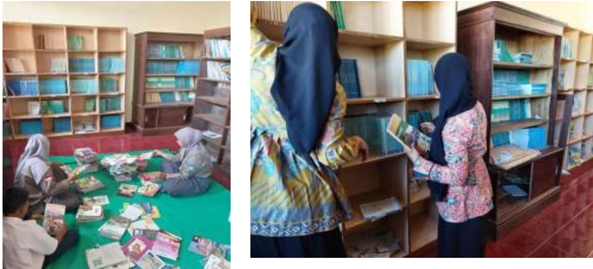
Gambar 7. Kegiatan Revitalisasi Perpustakaan