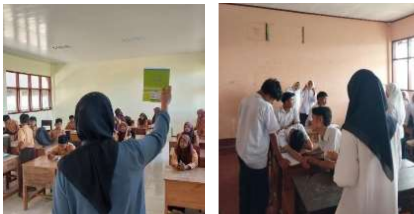
Gambar 4. Kegiatan kolaborasi dengan guru di kelas