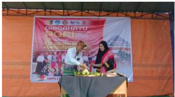
Gambar 11. Kegiatan Perayaan Hari Besar Nasional