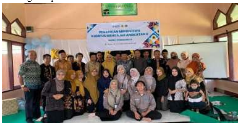
Gambar 16. Kegiatan ahir pengabdian

Pada saat pengimplementasian program kami mendapatkan pengalaman bekerja dengan tim pada saat pelaksanaannya, contohnya pada saat kami menjalankan program Sabtu Budaya yang berkaitan dengan pengembangan karakter siswa. Ada beberapa tantangan yang saya dan teman-teman temui seperti susahnya mengontrol siswa - siswi, melatih siswa - siswi untuk menari, hingga penentuan minat serta keinginan yang di inginkan siswa - siswi, dalam tantangan ini kesabaran, kerja sama anatar tim, dan rayuan adalah Solusi yang paling memungkinkan untuk menghadapi siswa - siswi tersebut.