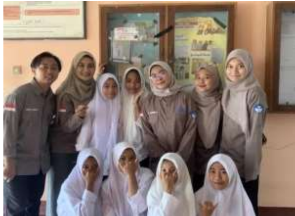
Gambar 2. Kegiatan posterisasi kelas