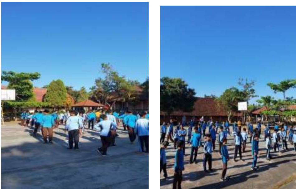
Gambar 8. Kegiatan Senam Bersama