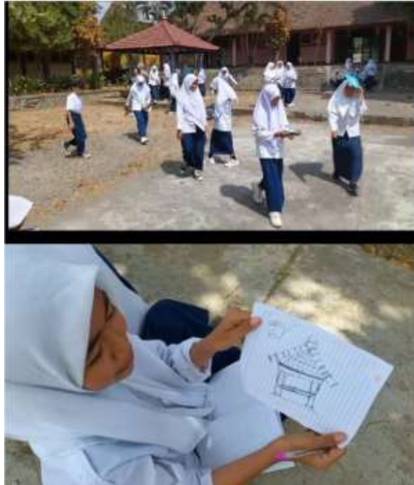
Gambar 5. Kegiatan Wisata Numerasi