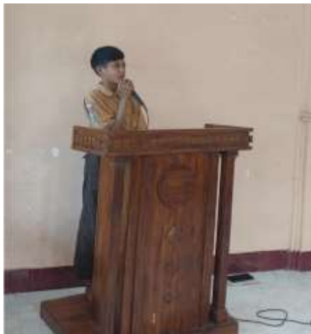
Gambar 14. Kegiatan Literasi setiap Jum'at