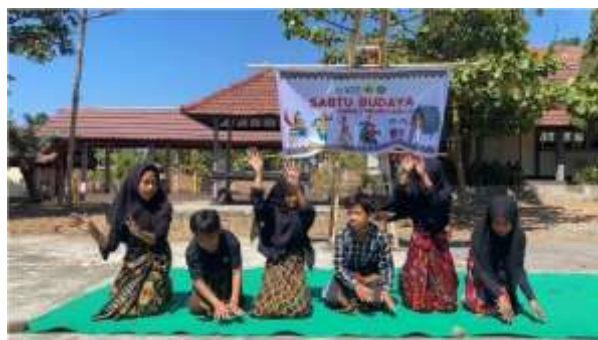
Gambar 9. Kegiatan Sabtu Budaya