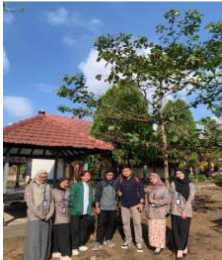
Gambar 13. Membuat Video Profil Sekolah