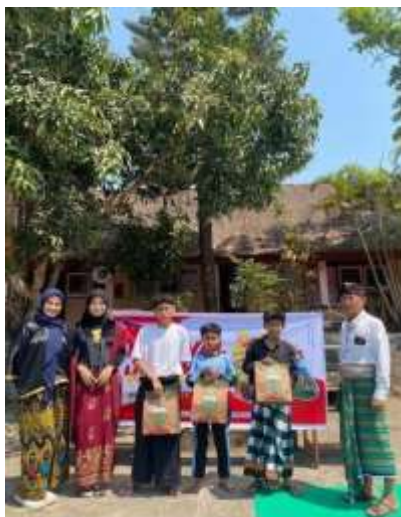
Gambar 15. Festival Literasi

Pada saat pengimplementasian program kami mendapatkan pengalaman bekerja dengan tim pada saat pelaksanaannya, contohnya pada saat kami menjalankan program Sabtu Budaya yang berkaitan dengan pengembangan karakter siswa. Ada beberapa tantangan yang saya dan teman-teman temui seperti susahnya mengontrol siswa - siswi, melatih siswa - siswi untuk menari, hingga penentuan minat serta keinginan yang di inginkan siswa - siswi, dalam tantangan ini kesabaran, kerja sama anatar tim, dan rayuan adalah Solusi yang paling memungkinkan untuk menghadapi siswa - siswi tersebut.