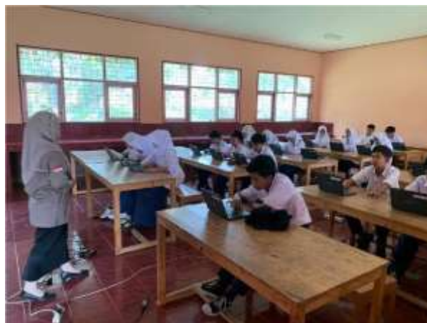
Gambar 6. Kegiatan MERANTIF