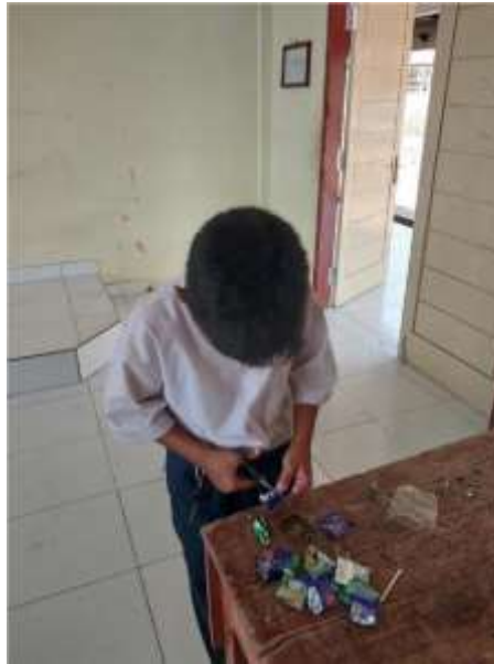
Gambar 10. Kegiatan 3 R (Reduce, Reuse, Recycle)