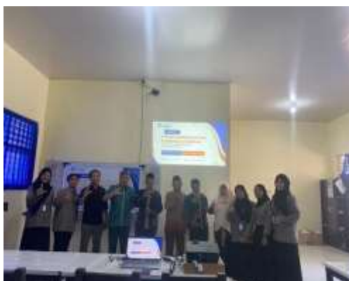
Gambar 1. Diskusi program-program kerja dengan pihak sekolah dan pengawas

Evaluasi berkala dilakukan untuk mengukur keberhasilan program. Indikator seperti peningkatan minat baca, pemahaman konsep matematika, dan hasil belajar secara keseluruhan menjadi tolok ukur efektivitas program. Dengan evaluasi ini, sekolah dapat menyesuaikan strategi agar hasil yang dicapai sesuai dengan harapan. Program "Pendampingan Literasi dan Numerasi Siswa" ini tidak hanya bertujuan meningkatkan hasil akademik, tetapi juga membangun karakter siswa, seperti kepercayaan diri, kemandirian, dan kemampuan berpikir kritis. Dengan langkah-langkah strategis ini, diharapkan SMPN 2 Pringgasela dapat menjadi model bagi sekolah-sekolah lain dalam upaya meningkatkan kualitas pendidikan.