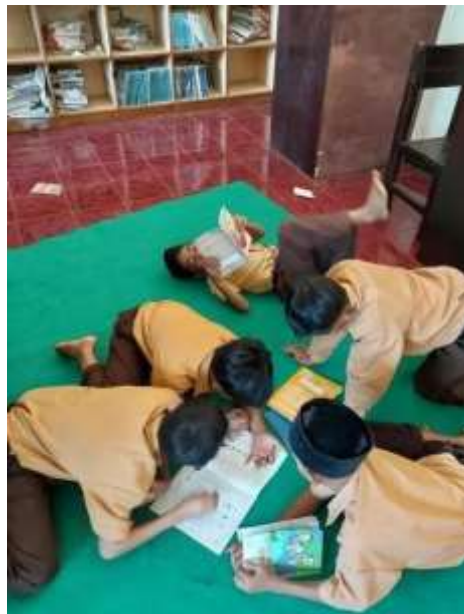
Gambar 3. Program BATUK